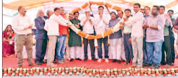
हरिभूमि न्यूज ►► उडैसरा(धमतरी)