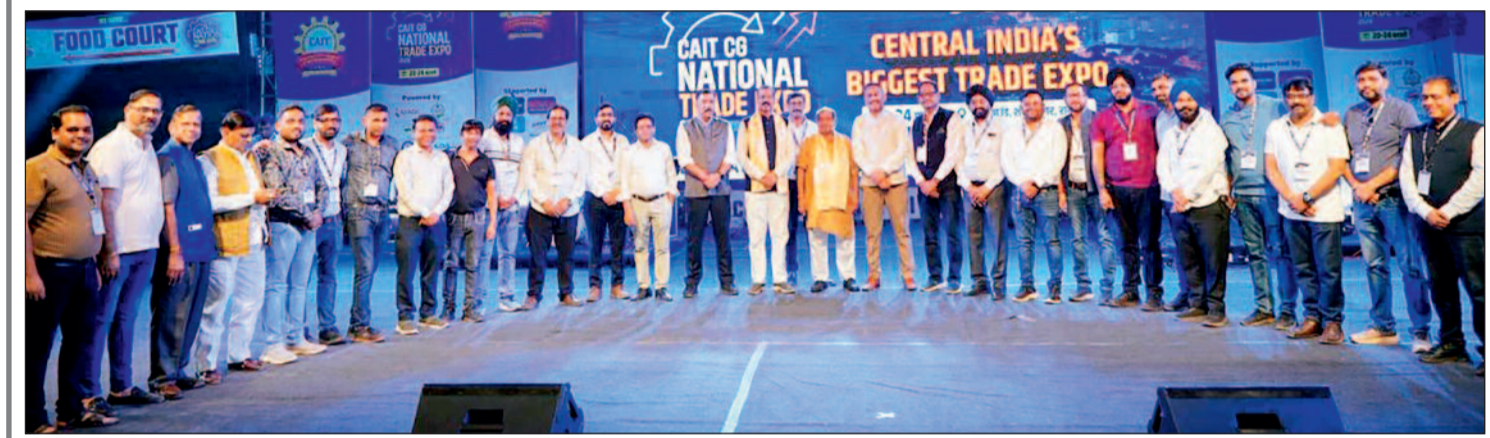
हरिभूमि न्यूज ►► रायपुर