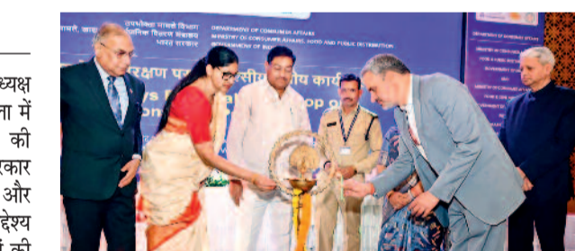
हरिभूमि न्यूज ►► रायपुर