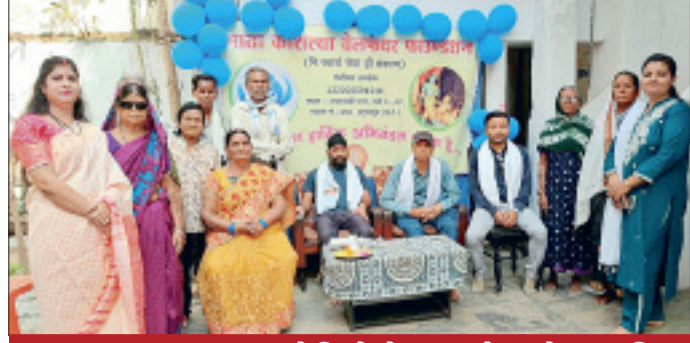
स्वयं सेवियों के सहयोग से संचालित वरिष्ठजन सेवा सदन का एक साल पूर्ण

वरिष्ठजन (वृद्धजनों) की सेवा में समर्पित संस्था के एक साल पूरे होने पर संस्था द्वारा समाजसेवियों एवं सहयोगियों का सम्मान समारोह आयोजित किया गया। शहर के इमली भाटा में माता कौशल्या वेलफेयर फाउंडेशन (पंजीकृत संस्था) द्वारा संचालित वरिष्ठजन सेवा सदन में यह समारोह गरिमामय माहौल में संपन्न हुआ। समाजसेवियों ने यहां वरिष्ठजनों को मिल रही सुविधाओं का जायजा लिया और बेहतर व्यवस्था के लिए संस्था के समर्पण पर आभार जताया। साथ ही आगामी दिनों में भी सहयोग बनाए रखने की प्रतिबद्धता जताई। इस अवसर पर रायपुर, समोदा,